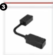
3 Conector flexible