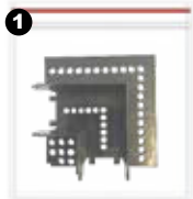
1 Magnetic track

Accesorios de unión (se venden por separado)