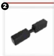
2 Conector para riel