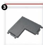
Unión en L