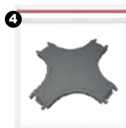
Unión en X