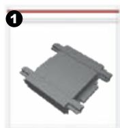
Unión para riel

Accesorios de unión (se venden por separado)