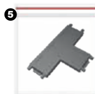
Unión en T