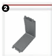
Unión para muros