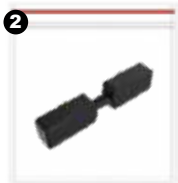
Conector para riel