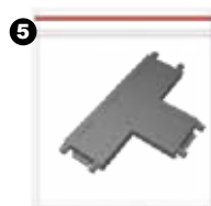
5 Unión en T