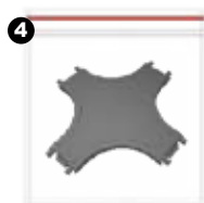
4 Unión en X