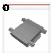
1 Unión para riel

Accesorios de unión (se venden por separado)