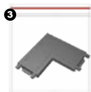
3 Unión en L