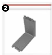
2 Unión para muros